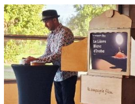
Kamishibai - Théâtre de Papier