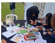
Atelier origami & calligraphie