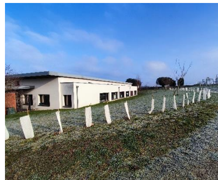
Ecole les 2 Aires

Le 3 octobre 2025, le Maire avait signé la charte d'engagement en faveur de ce projet, par laquelle la commune s'engage à maintenir la haie en place sur une durée minimum de 10 ans, à la gérer et à la préserver