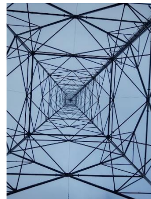
Vue d'en bas