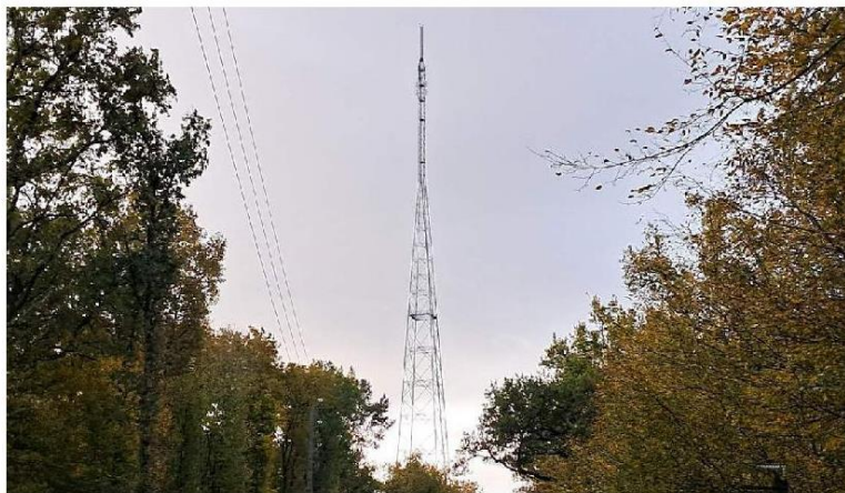
Le nouveau pylône de diffusion TowerCast, à Souvigny-de-Touraine, culmine à 213 mètres : une prouesse technique qui en fait l'un des plus hauts de France.

Pesant 150 tonnes, le pylône a nécessité vingt pieux de douze mètres chacun pour sa fondation. Ses quatre points d'ancrage reposent sur 100 m 2 de béton et huit tonnes d'acier destinées au ferrailage. L'assemblage a mobilisé une grue de 750 tonnes, tandis que les dernières opérations, en raison de la hauteur et de la précision requise, ont été réalisées par hélicoptère. Ce relais constitue une avancée pour la diffu-