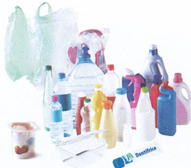
Tous les emballages plastiques