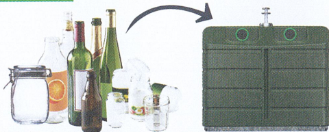
Bouteilles, pots et bocaux en verre