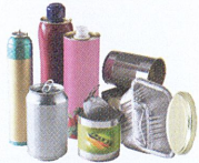
Tous les emballages métalliques