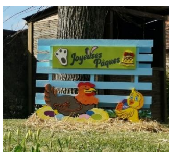
Parking de la mairie