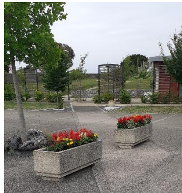
Fleurissement Parking Marpa/Ecole