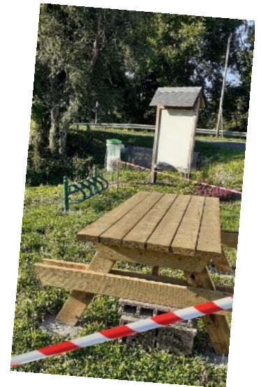
Travaux en cours Rue Alfred de Vigny