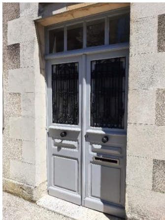
La porte de la mairie a retrouvé de belles couleurs