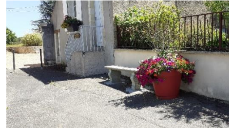
Place Général de Gaulle